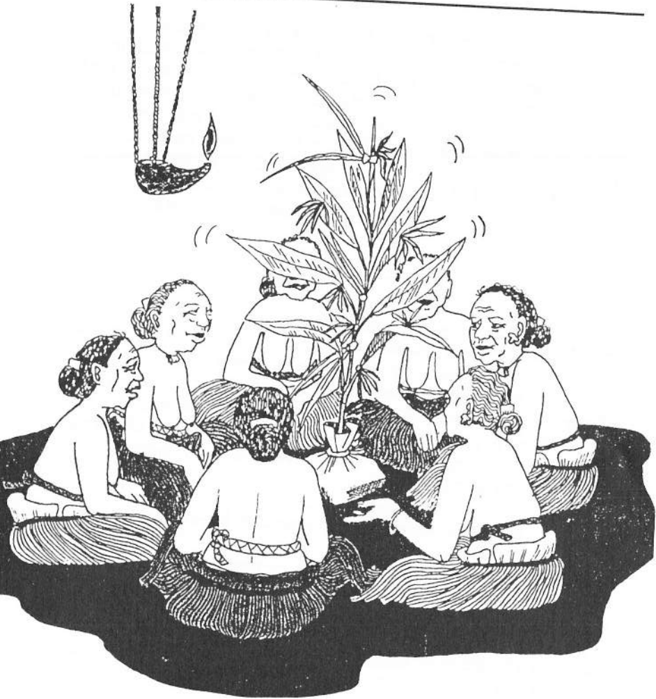
Oterekel a Sis

medengeli a beches el mo nguu a kebekuul ma lehub e ng teleuechel dui el mo sechelirir.